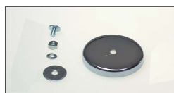
取付けマグネット (1個)