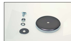
取付けマグネット